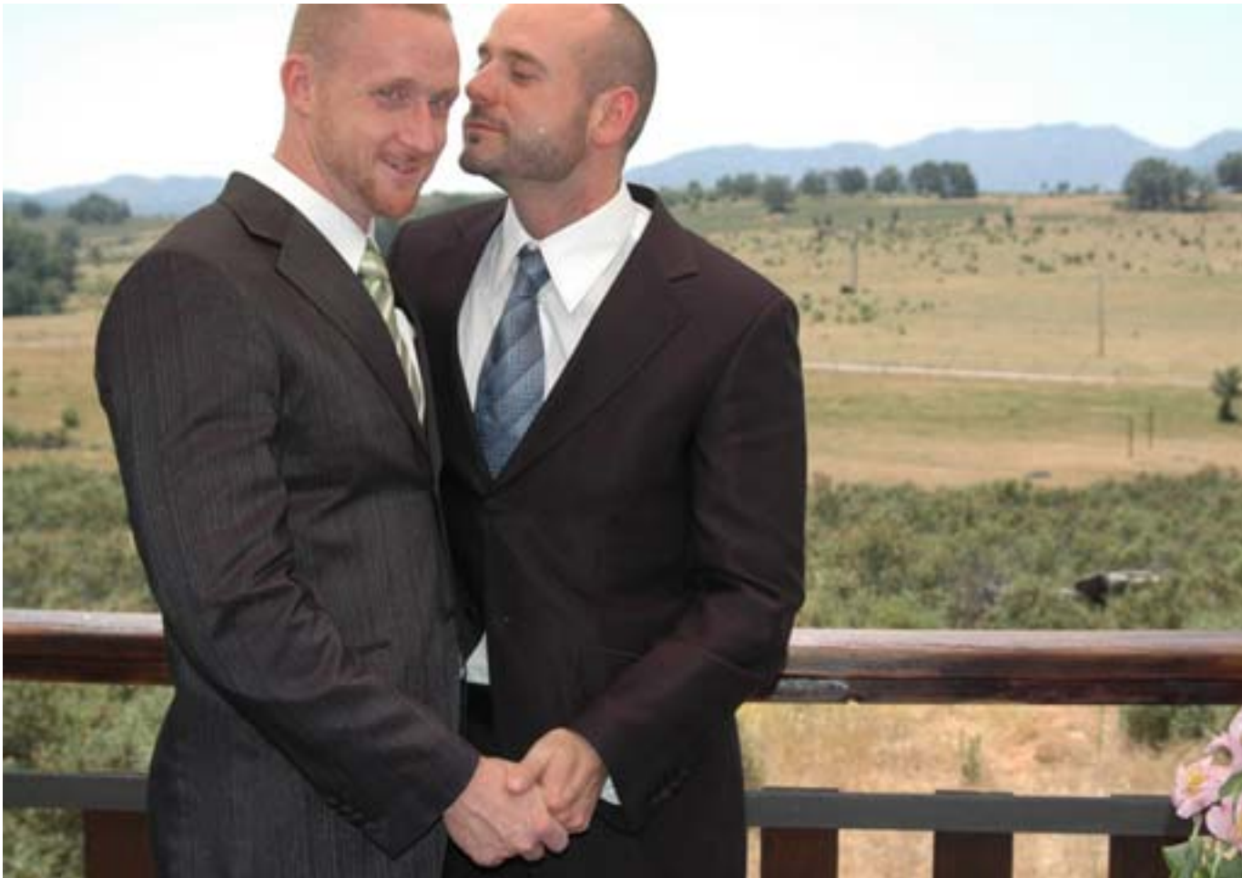
Campillo sí, quiero (2007, Andres Rubio)

En este sentido una de las cuestiones más importantes en el proceso de crecimiento de DIVERSA fue descubrir que realmente en el exterior existe un mercado de películas gay, que dentro de un mercado de películas en general se mueve mucho. En cuanto empezamos a enviar a festivales de afuera cortometrajes argentinos que habían participado en DIVERSA (que fue el primero en su tipo en Latinoamérica) nos pasó que casi inmediatamente nos empezaron a llover invitaciones para ir a diferentes lugares a presentar las películas, tantos que no los podíamos abarcar. ¡Igualmente lo que pudimos lo hicimos!