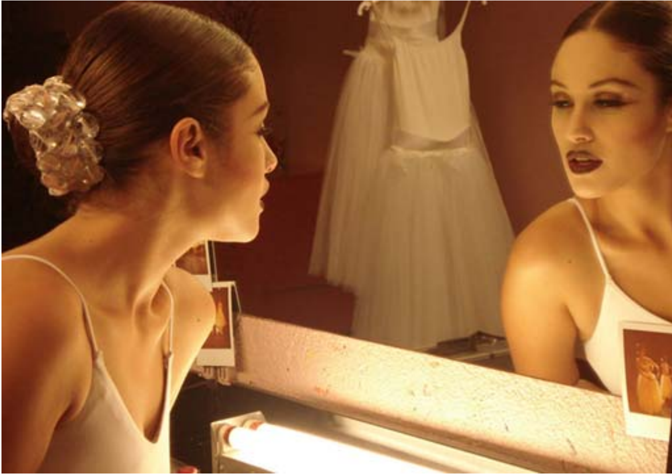
Iguales (2008, cortometraje, Javier de la Torre)